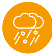
Sturm und Hagel